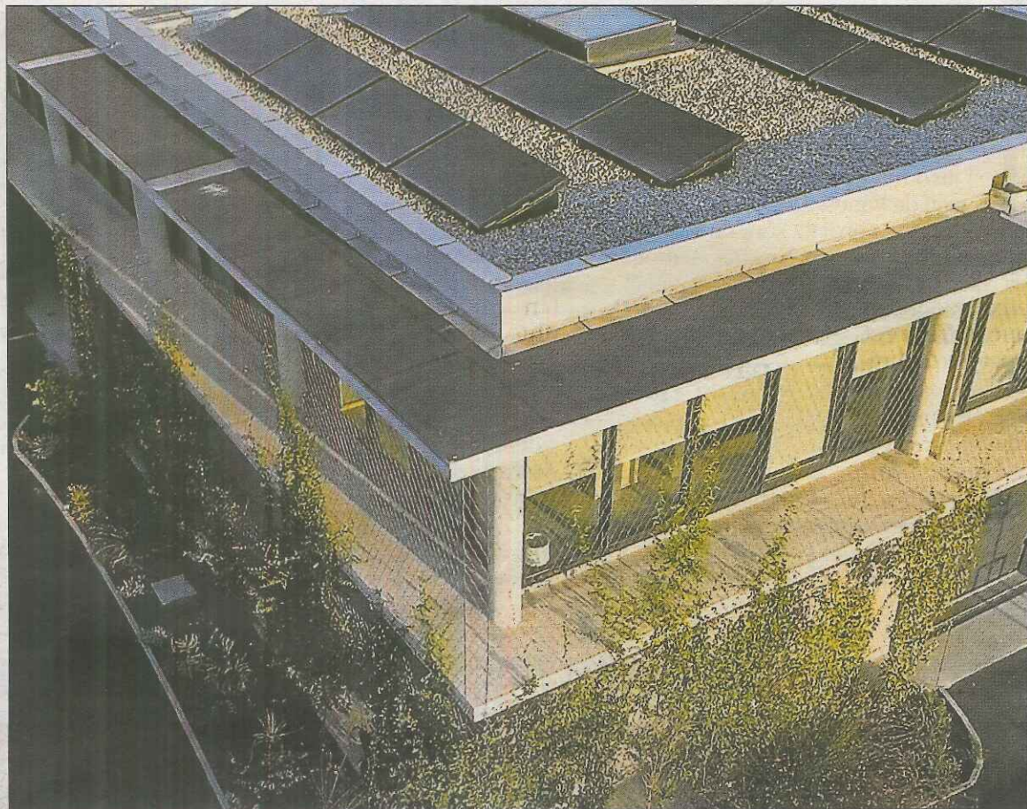
FHE Group développe une technologie qui permet de stocker le surplus d'énergie produit.

FHE Group révolutionne le stockage de l'énergie. Implantée dans la zone de Technosud à Perpignan, l'entreprise a mis au point une « batterie thermique » baptisée Inelio, qui conserve l'énergie. Explications.